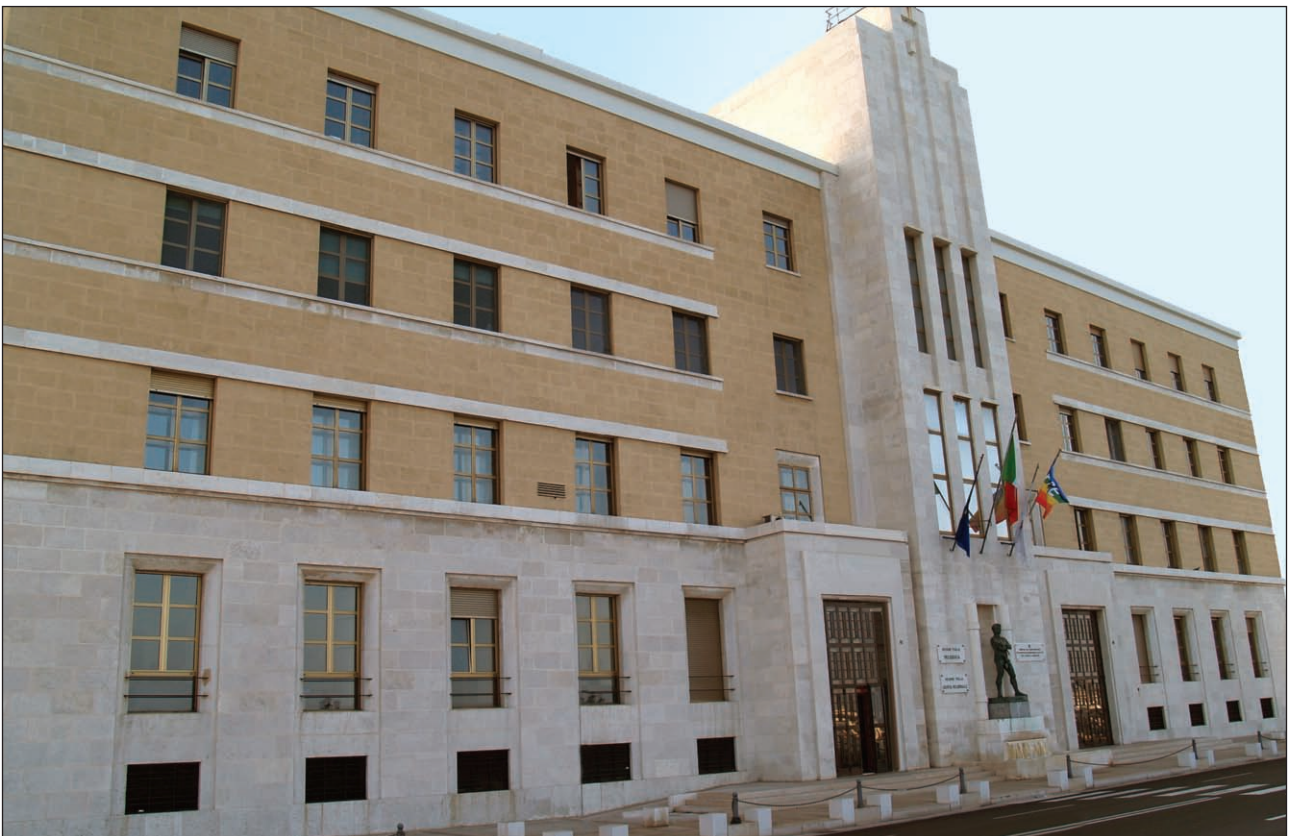
Sede Presidenza Giunta Regionale