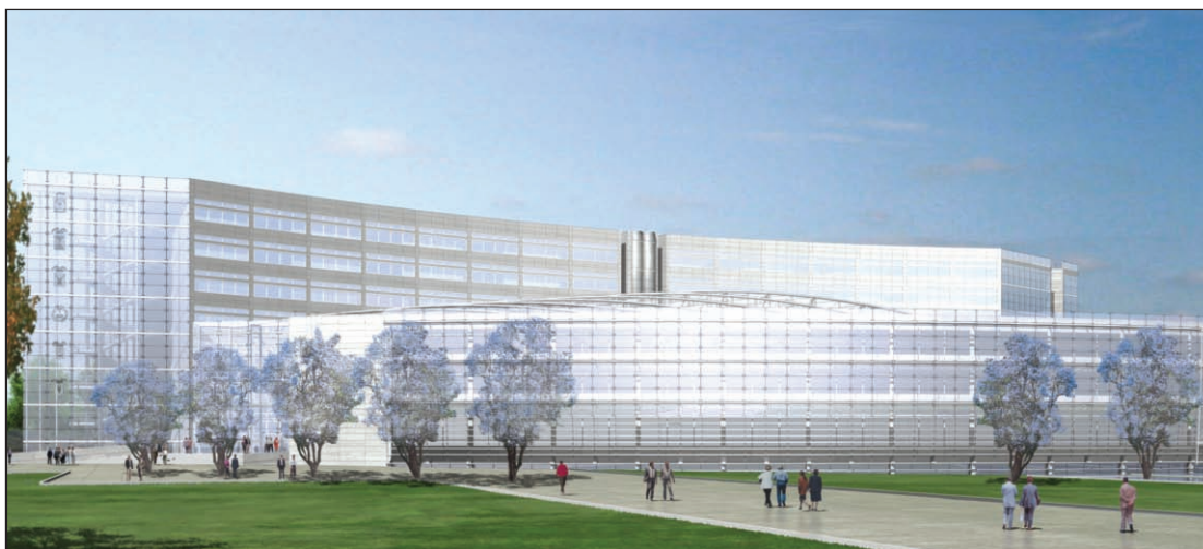
Progetto nuova sede Consiglio Regionale